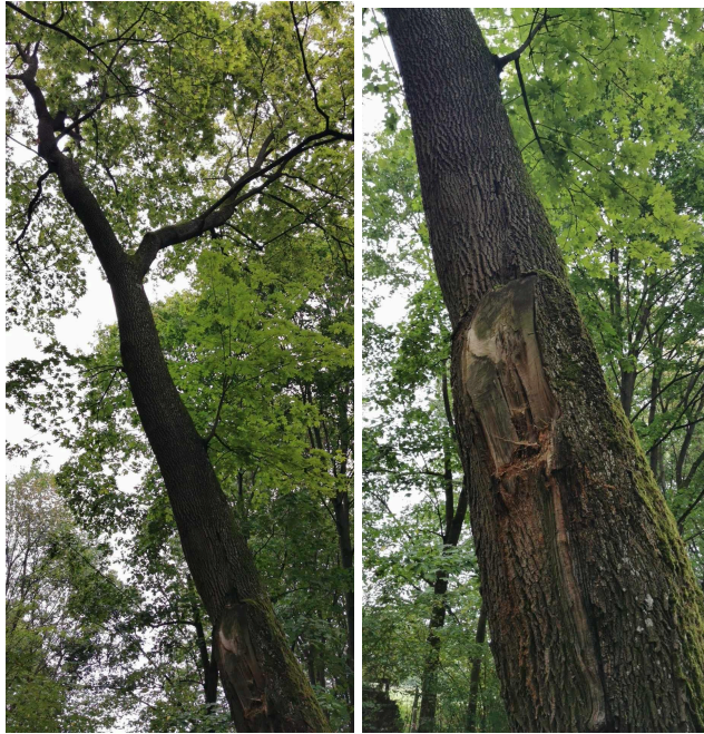
259 Kl klon zwyczajny Acer platanoides