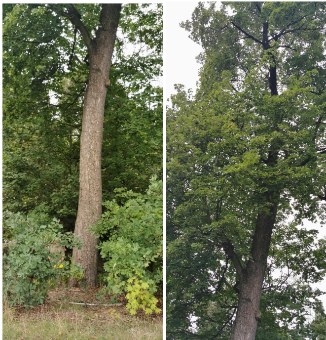
262 Kl klon zwyczajny Acer platanoides