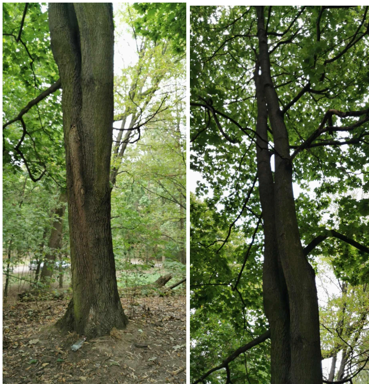
268 Kl klon zwyczajny Acer platanoides