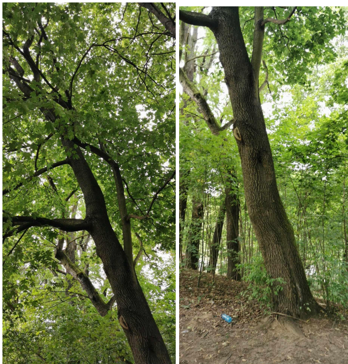
267 Kl klon zwyczajny Acer platanoides